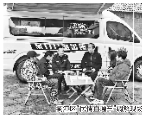
衢江区“民情直通车”调解现场

去年8月,云溪乡发生一起民房起火事故,已经入睡的独居老人被烟感报警器的警报声惊醒后成功脱困。这次成功避险的背后,是当地构建的“安居守护”智慧系统在发挥作用。