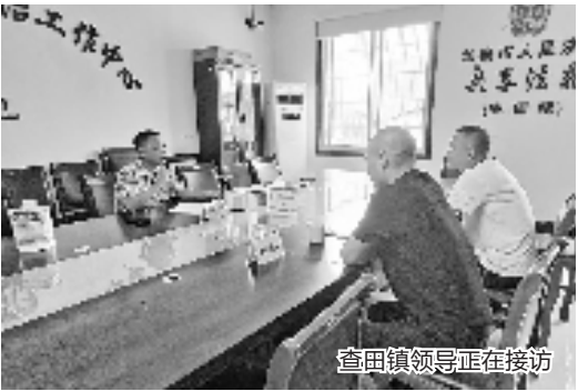
查田镇领导正在接访

同时,龙泉市持续推动调解工作本地化、精细化、品牌化发展,总结推广“七步诗”“永和说事”等