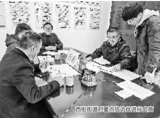
西街街道对重点信访件进行会商

在化解群众“心中结”过程中,龙泉市领导干部不局限于“坐诊”,等着问题上门,而是积极“出诊”,带案约访化解积案。