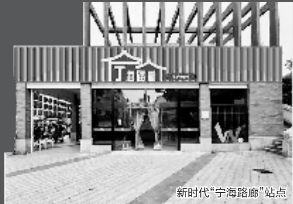
新时代“宁海路廊”站点

治国安邦,重在基层。 党的二十大报告提出:完善社会治理体系,健全共建共治共享的社会治理制度。提升社会治理效能,畅通和规范群众诉求表达、利益协调、权益保障通道,建设人人有责、人人尽责、人人享有的社会治理共同体。 近年来,宁海县从“宁海路廊”文化典故中汲取基层治理的智慧和力量,打响“宁海路廊”服务品牌,积极探索培育发展志愿服务组织、引导群众有序参与基层社会治理的新路径,推动社区由“陌生人社会”向“熟人社会”转变,不断激发基层社会治理活力。