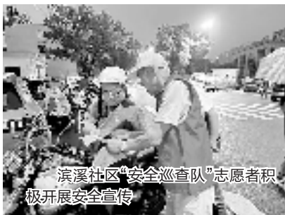
滨溪社区“安全巡查队”志愿者积极开展安全宣传

宁海主城不大,从南到北不到20公里。 如何将“宁海路廊”精神融入基层社会治理?如何以“送万家福”的情怀造福宁海,让生活喜乐、百姓安康、城市幸福?宁海积极搭建基层民主议事平台,推行议事协商机制,让群众在自治中“唱主角”,民主决策定“乾坤”。