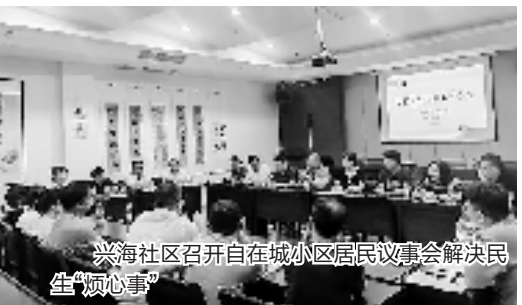
兴海社区召开自在城小区居民议事会解决民生“烦心事”