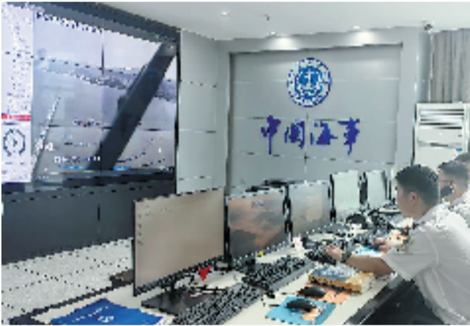
海事部门严阵以待