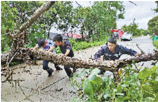
清除倒伏在路上的树干

发盒饭。自7日下午开始,石塘镇就将附近工地上120余名外来务工人员 and 家属从临时住房转移到了安置点内,并提供生活物资,为他们搭起安全温暖的“避风港”。