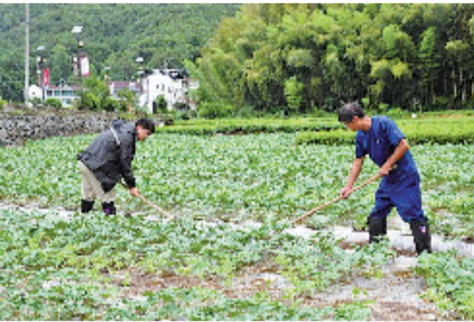
帮助瓜农守护瓜田