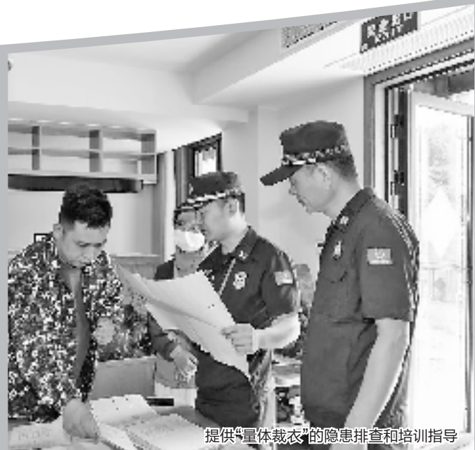
提供“量体裁衣”的隐患排查和培训指导