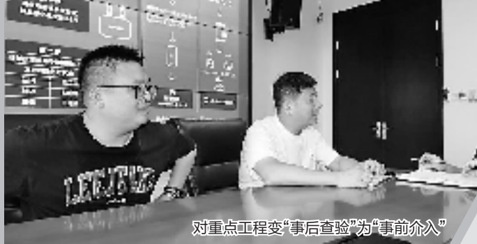
对重点工程变“事后查验”为“事前介入”