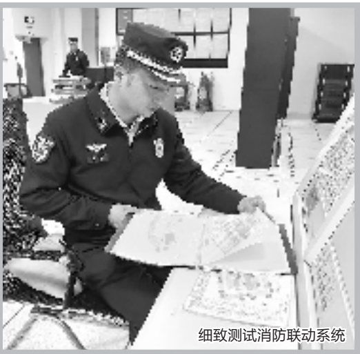
细致测试消防联动系统

在湖州首创奥特莱斯二期消防设施改造项目中，大队联合多部门组建服务小组，主动上门，在项目设计阶段就提前介入。针对火灾自动报警、喷淋布局、防排烟等核心系统，服务小组结合综合体人流密集、业态复杂的特点，提出关键优化建议，确保方案一步到位符合最新规范；同时，组织物业开展消防设施操作及应急疏散能力专项培训，并承诺竣工后指导全系统联动测试，确保设施可靠运行。这种“提前跑”“全程陪”的服务模式，既从源头提升了安全系数，又为企业节省了宝贵的时间成本，赢得了“高效护航发展”的赞誉。