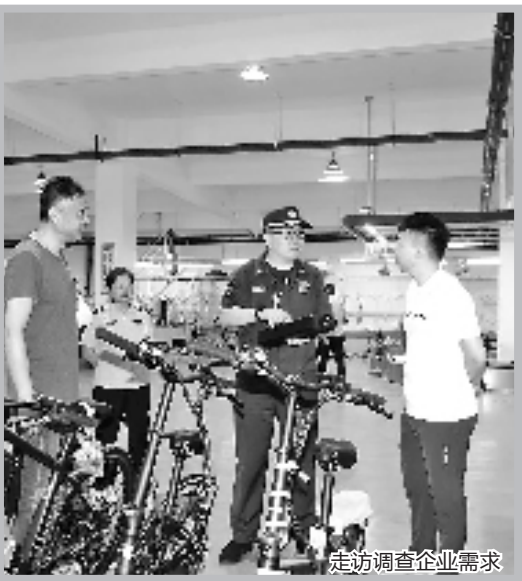
走访调查企业需求

近年来，湖州市消防救援支队始终坚持倾听企业呼声，紧盯营商环境的重点领域和关键环节，聚焦企业、群众关注的热点、焦点、难点以及反映强烈的问题，不断改进工作方式方法，从坐等上门检查到主动邀约解难、从单一监管到多部门协同“把脉”、从事故后处罚到事前及时排患，一场深刻的消防服务转型正在太湖南岸生动铺展。