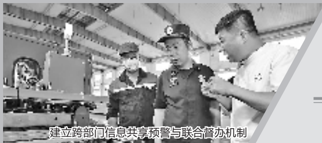
建立跨部门信息共享预警与联合督办机制