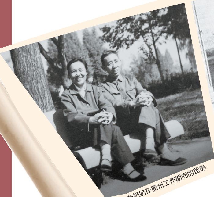
爷爷奶奶在衢州工作期间的留影