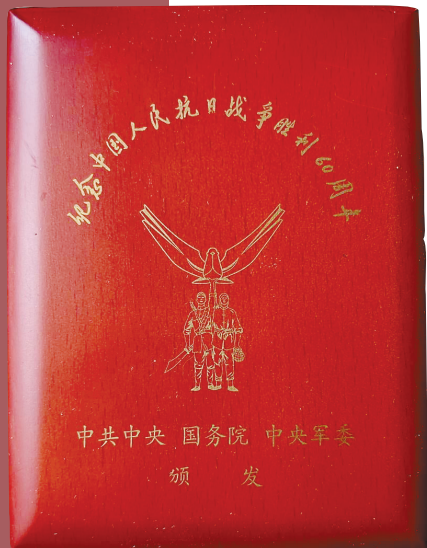
爷爷留下的,由中共中央、国务院、中央军委颁发的纪念抗战胜利60周年纪念章、纪念册