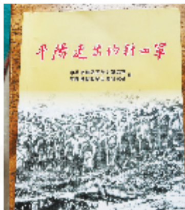
中共党史出版社出版的《平阳走出的新四军》一书中,写着奶奶的名字

干校结业后,组织让奶奶选择接下去的革命任务,第一个是留在机关工作,第二个是在浙南进行革命宣传