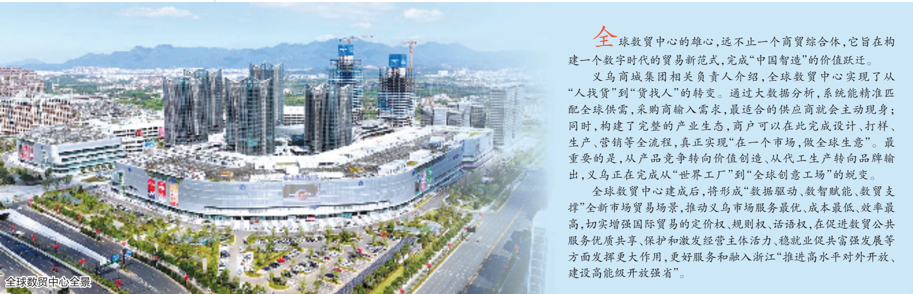
全球数贸中心全景

全球数贸中心开业期间,义乌还将配套举办全国专业市场数贸峰会、品牌出海签约活动、AI+市场数贸峰会、国际小商品创意设计大赛作品展、国际伙伴日专场、万名外商进市场等专题商贸活动,以及全球网红打卡、“数贸丝路”灯光秀/无人机表演、义乌全球音乐现场等文娱热场活动,通过系列有影响、聚人气的活动,更好向世界传递新市场、新贸易、新商机。