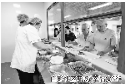
白彭社区开设“幸福食堂”