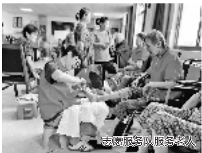
志愿服务队服务老人

志愿服务是慈溪基层治理中不可或缺的温暖力量。如今,这股力量正从零散、自发的活动,向制度化、品牌化的方向