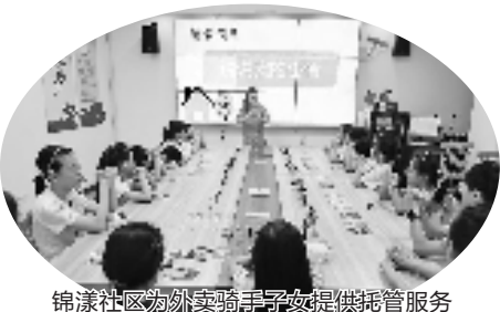
锦漾社区为外卖骑手子女提供托管服务

今年以来,慈溪市委社会工作部以党建为引领,聚焦新兴领域党建、志愿服务深化、网格化服务管理提质和基层治理创新,推动社会治理重心下移、力量下沉、服务下置,让改革发展成果更多更公平惠及人民群众。