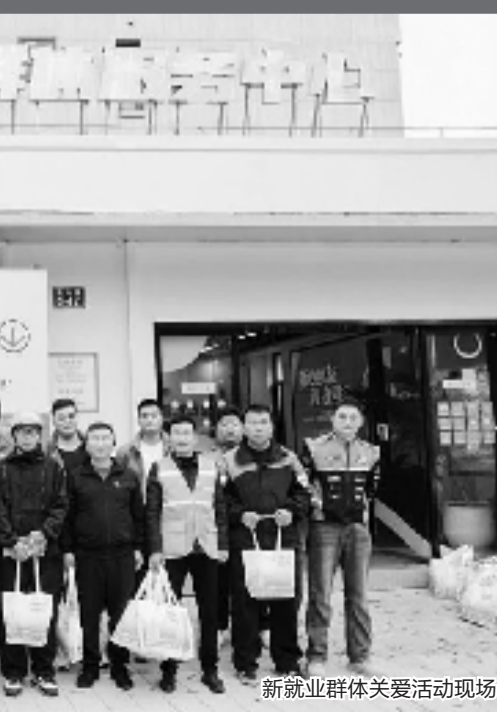
新就业群体关爱活动现场