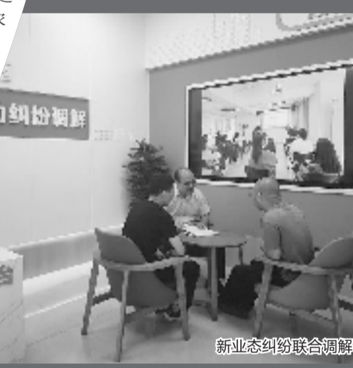
新业态纠纷联合调解