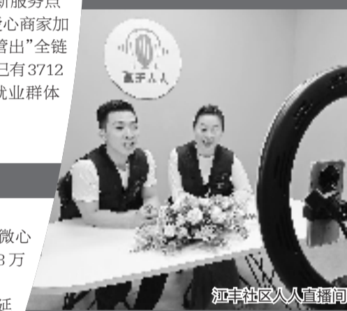
江丰社区人人直播间