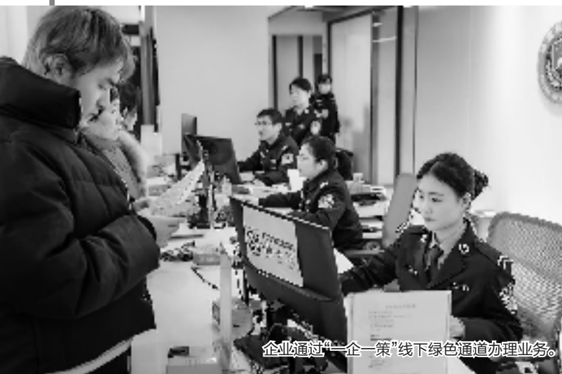
企业通过“一企一策”线下绿色通道办理业务。

“如果没有出入境管理大队的加急服务,海外生产线投产将延误,企业会面临不小损失。”某清洗机有限公司负责人对路桥公安分局出入境管理大队的高效服务表达谢意。