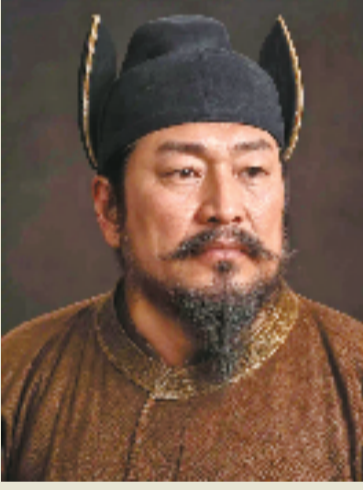
复旦大学科技考古团队根据李克用颅骨和基因数据制作了李克用的肖像复原示意图。