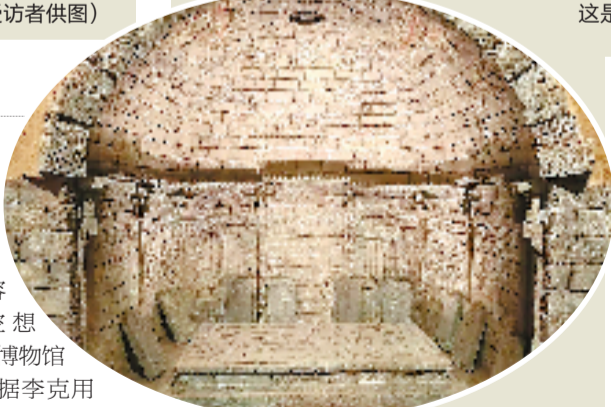
山西代县博物馆根据1989年李克用墓发掘现场情况,制作了墓穴复原图。