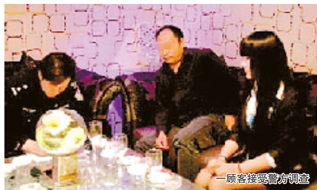
一顾客接受警方调查