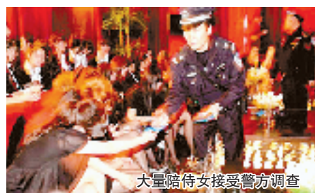
大量陪侍女接受警方调查