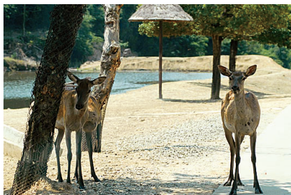
只能在车里拍一拍它们

去过野生动物世界的人都知道,骆驼、梅花鹿、长颈鹿等温顺动物,最喜欢与游客接触。它们漫步在大路上,冷不丁就将头伸进车窗,截下游客的“买路草”。所以,一见到骆驼,我就准备开车窗。可一名管理人员立即走过来,拦住我说:“现在,不能喂养,也不能下车合影了,只能坐在车上观看。”就连通往“狐猴岛”的桥也有专人把守,除了饲养员外,其他人员一律不让通过。