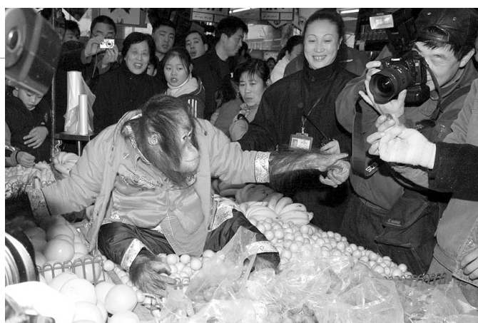
2005年1月30日,杭州野生动物世界的猩猩逛超市