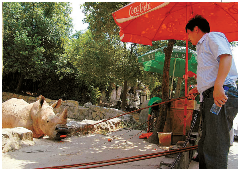
白犀牛的“筷子”足够长

可是,来了野生动物世界,不能摸,不让喂,还有什么乐趣? 在步行区,管理人员满足了游客的瘾头。他们设计了很多道具,为的就是拉开游客与野生动物的距离。比如,白犀牛的喂养工具就是长长的竹竿,这一头插着胡萝卜,那一头握在游客手中。省野生动植物保护管理总站的俞根连说,种种约束,为的是防止野生动物观赏展演单位片面追求经济效益,用不正当方式对待野生动物。而拉远游客与动物的距离,是为避免动物伤人。他说,林业厅还专门设立了举报电话,0571-87399196,欢迎游客监督。