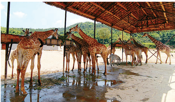
长颈鹿不再吃“拦路草”

去过野生动物世界的人都知道,骆驼、梅花鹿、长颈鹿等温顺动物,最喜欢与游客接触。它们漫步在大路上,冷不丁就将头伸进车窗,截下游客的“买路草”。所以,一见到骆驼,我就准备开车窗。可一名管理人员立即走过来,拦住我说:“现在,不能喂养,也不能下车合影了,只能坐在车上观看。”就连通往“狐猴岛”的桥也有专人把守,除了饲养员外,其他人员一律不让通过。